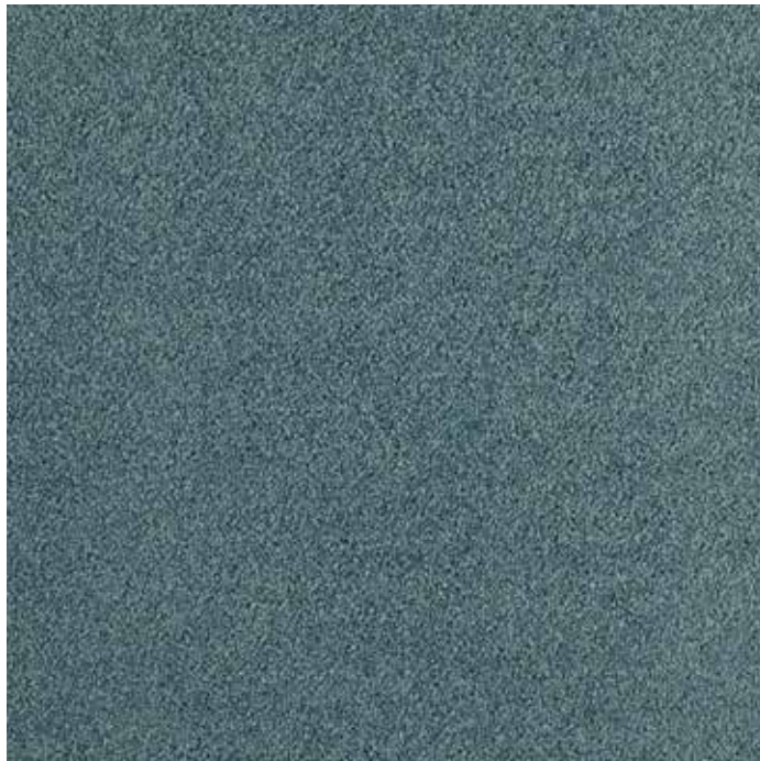
Lé - PAON 150

De la composition de la moquette jusqu'à sa fabrication, Balsan met un point d'honneur à respecter l'environnement. A la manière d'un fil d'Ariane, l'éco-conception intervient dans chaque phase de la production qui est entièrement réalisée localement.