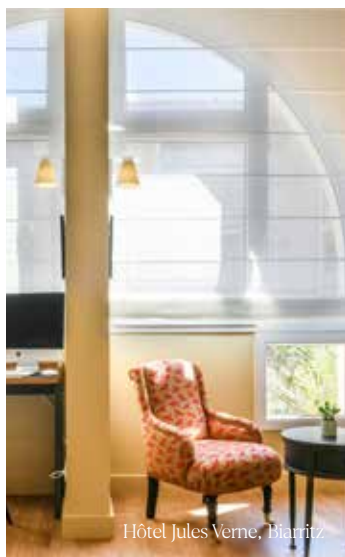
Hôtel Jules Verne, Biarritz

Pensés pour sublimer les espaces et offrir un confort absolu , nos stores s'intègrent avec élégance dans les établissements hôteliers les plus exigeants. Finitions raffinées, choix variés de tissus, mécanismes discrets et durables : chaque détail est étudié pour garantir à vos clients une atmosphère intime, apaisante et résolument décorative . Nos collections sur-mesure s'adaptent à l'identité de votre établissement, tout en répondant aux standards les plus élevés en matière de design et de performance.