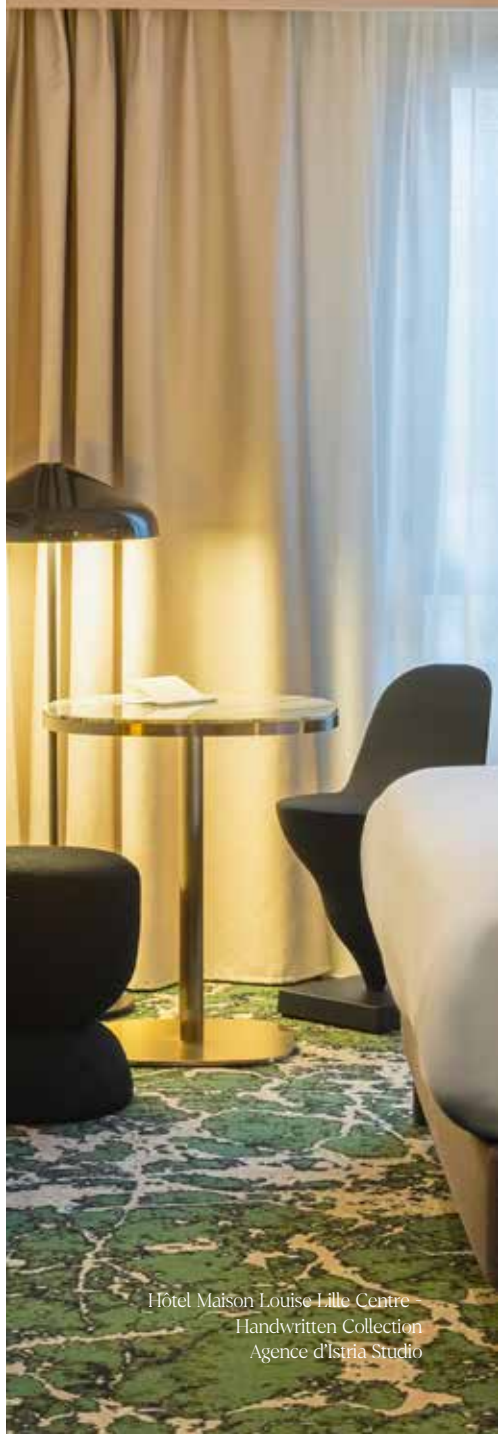
Hôtel Maison Louise Lille Centre Handwritten Collection Agence d'Istria Studio