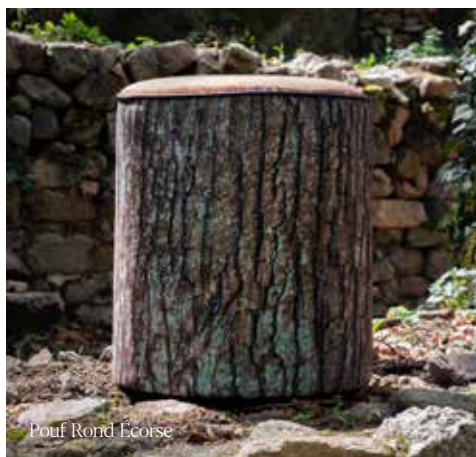
Pouf Rond Écorce

Le pouf personnalisable d'étoffes inspire à l'avantage de pouvoir s'inviter dans tous les styles décoratifs des hôteliers les plus exigeants . Véritable invitation au voyage et à l'imaginaire, l'impression numérique permet un effet trompe l'œil saisissant !