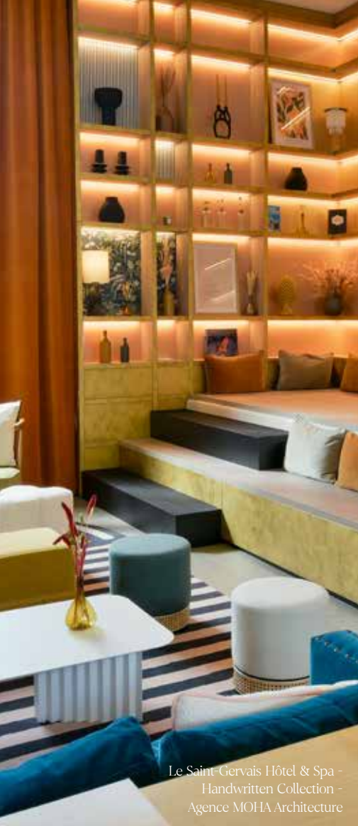
Le Saint-Gervais Hôtel & Spa - Handwritten Collection - Agence MOHA Architecture