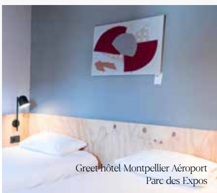
Greet hôtel Montpellier Aéroport Parc des Expos