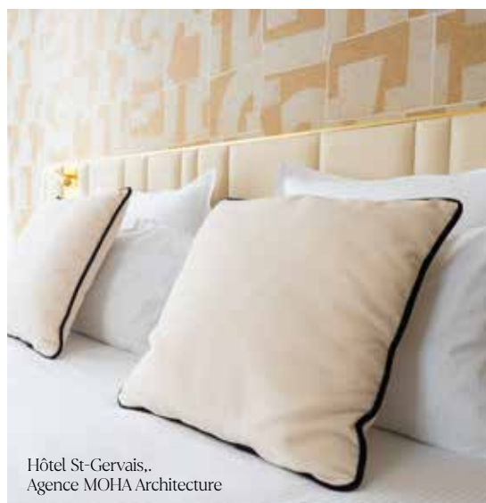
Hôtel St-Gervais,, Agence MOHA Architecture

Velours, imprimés, jacquard, couleurs unies, motifs graphiques ou encore textures naturelles... sélectionnez les matières et les teintes qui s'accordent parfaitement à l'intérieur de votre établissement. Les coussins décoratifs habilleront aussi bien le lit de la chambre que le canapé ou le fauteuil du lobby d'hôtel. Également disponible en tissu recyclé.