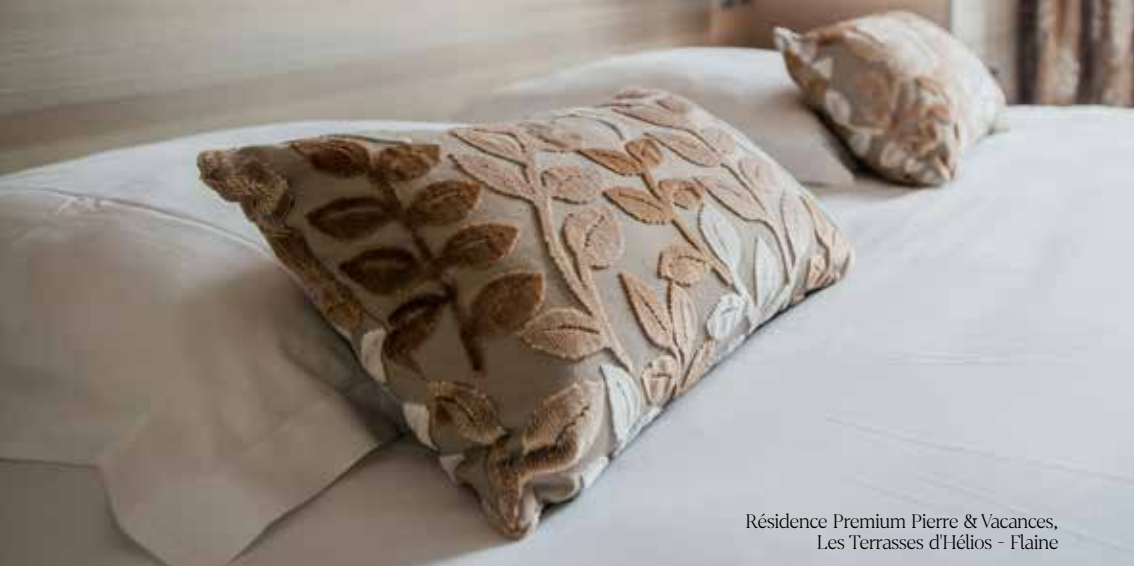
Résidence Premium Pierre & Vacances, Les Terrasses d'Hélios - Flaine