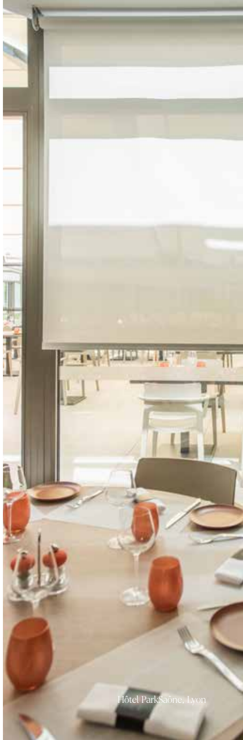
Hôtel ParkSaône, Lyon