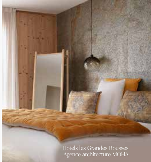
Hotels les Grandes Rousses Agence architecture MOHA

Que vous recherchiez la simplicité, le contraste, la matière réversible ou le confort ouaté, nous façonnons des créations sur-mesure , pensées pour s'intégrer harmonieusement à vos projets hôteliers. Textures, finitions, associations de tissus, jeu de matières, déhoussable : le champ des possibles est vaste, et chaque réalisation s'adapte aux contraintes de vos espaces comme à vos inspirations créatives.