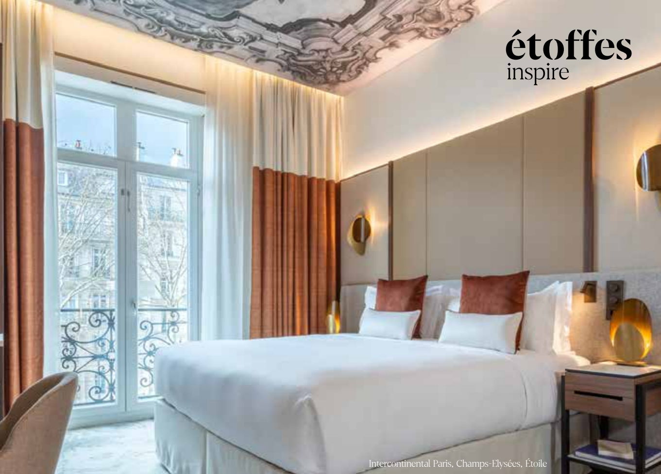
Intercontinental Paris, Champs-Elysées, Étoile