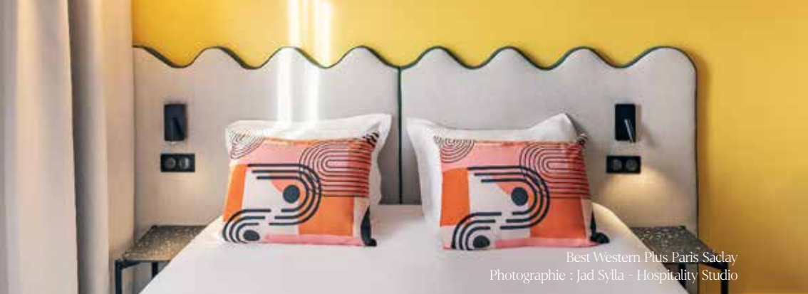
Best Western Plus Paris Saclay