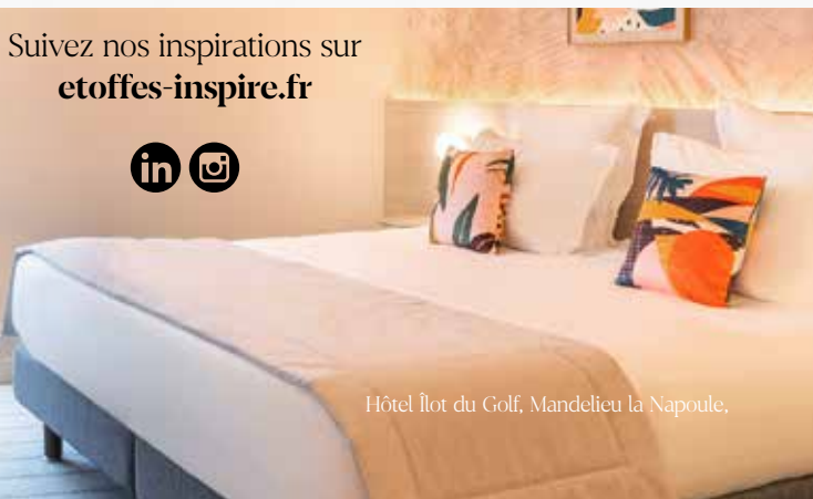
Hôtel Îlot du Golf, Mandelieu la Napoule,