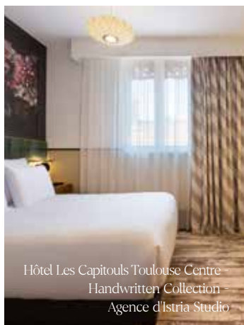
Hôtel Les Capitouls Toulouse Centre - Handwritten Collection - Agence d'Istria Studio

Notre approche repose sur un accompagnement complet, incluant recherche & développement, conseils, sourcing de tissus parmi notre collection, notre réseau d'industriels & éditeurs ou par la personnalisation avec l'impression numérique textile et l'installation.