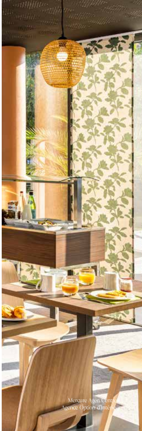
Mercurie Agen Centre Agence Option d'Intérieur