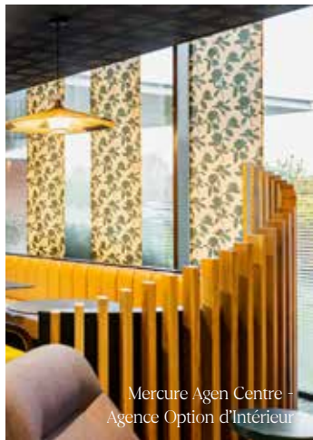
Mercurie Agen Centre - Agence Option d'Intérieur

Elles sont un élément emblématique de l'architecture et de la décoration intérieure japonaise. Ces panneaux coulissants en tissu permettent de diffuser la lumière subtilement, créant une ambiance douce et apaisante dans les intérieurs. Les parois japonaises sont aussi utilisées pour séparer les espaces tout en permettant une certaine flexibilité. Contrairement aux murs solides, les parois japonaises peuvent être facilement glissées pour ouvrir ou fermer des zones selon les besoins.