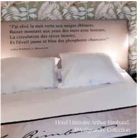
Hôtel Littéraire Arthur Rimbaud, BW Signature Collection